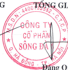
Đặng Quốc Bảo